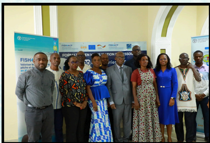
photo de l'événement